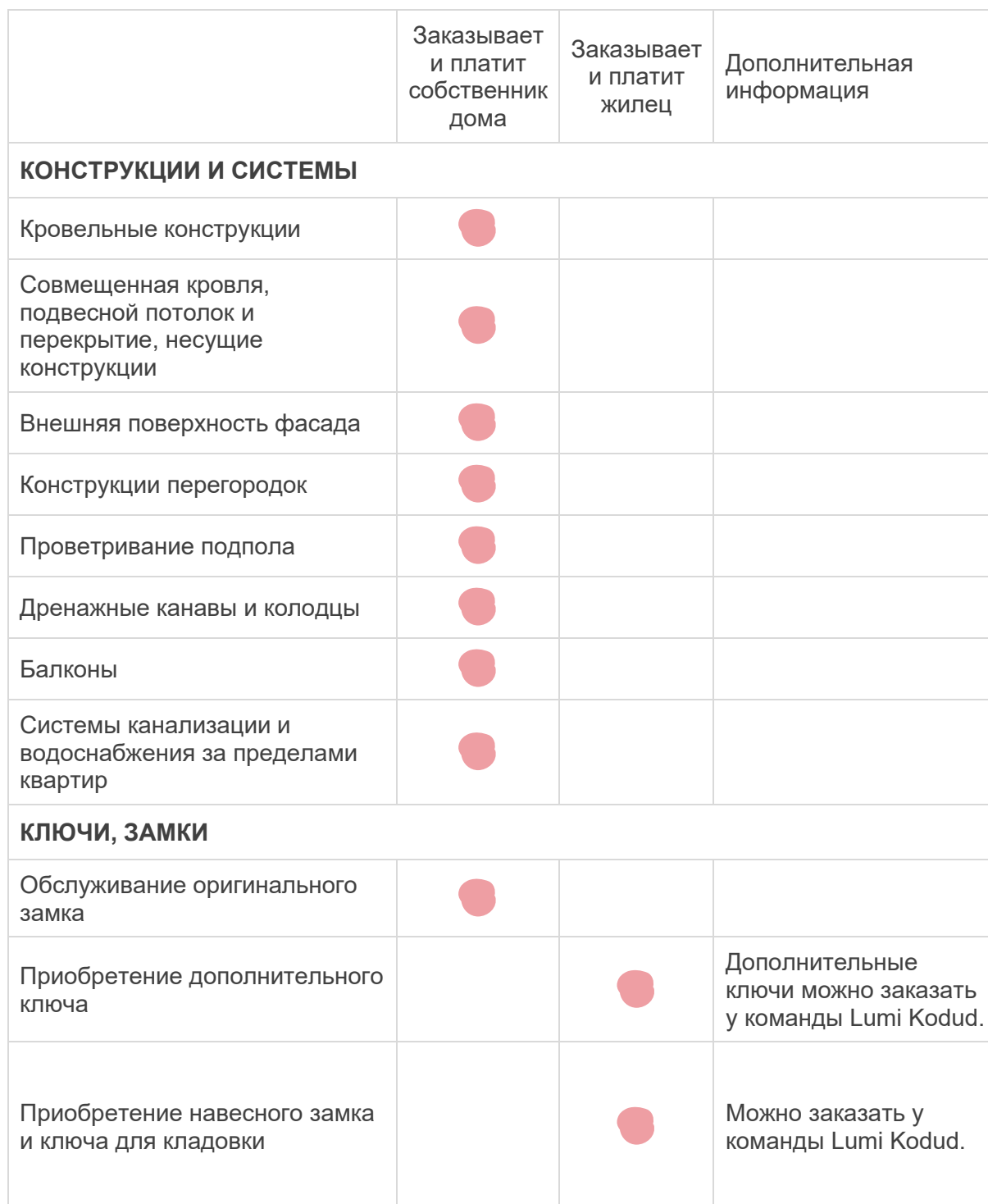
ТАБЛИЦА РАСПРЕДЕЛЕНИЯ ОТВЕТСТВЕННОСТИ, СВЯЗАННОЙ С ПОДДЕРЖАНИЕМ ПОРЯДКА В СЪЕМНЫХ КВАРТИРАХ